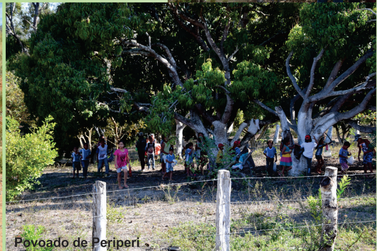
Povoado de Periperi

O lugar de onde eu vim se chama Baixa do Muquém . Lá tem uma igreja, uma escola, poucas casas e um lago que até pouco tempo estava vazio. Mas, depois das últimas chuvas, encheu novamente. Sobre a natureza, não tem muita poluição. Às vezes, os carreteiros jogam lixo nas estradas, mas os moradores estão sempre limpando.