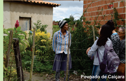
Povoado de Caiçara