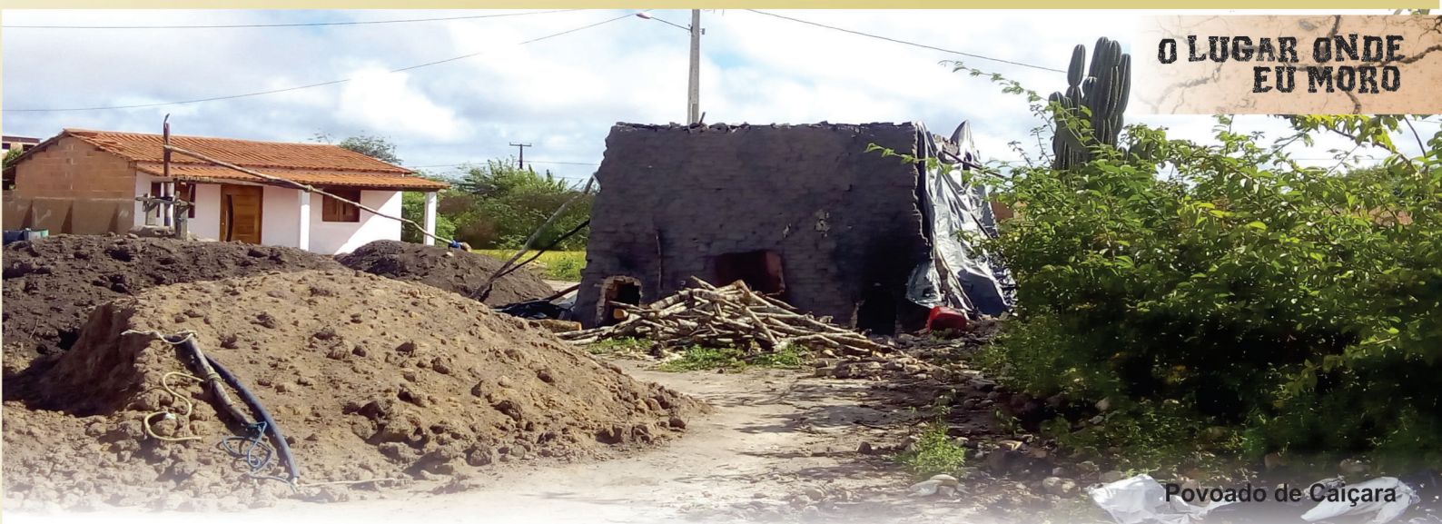
Povoado de Caiçara

A extração de argila nas olarias pode ser definido como negativo e resulta da ação que induz o dano à qualidade de um fator ambiental. O desmatamento da vegetação nativa, a poluição do ar e do solo, os esgotos a céu aberto, a construção de moradias em locais inadequados, o aumento das cavas e a possibilidade de esgotamento da argila são exemplos.