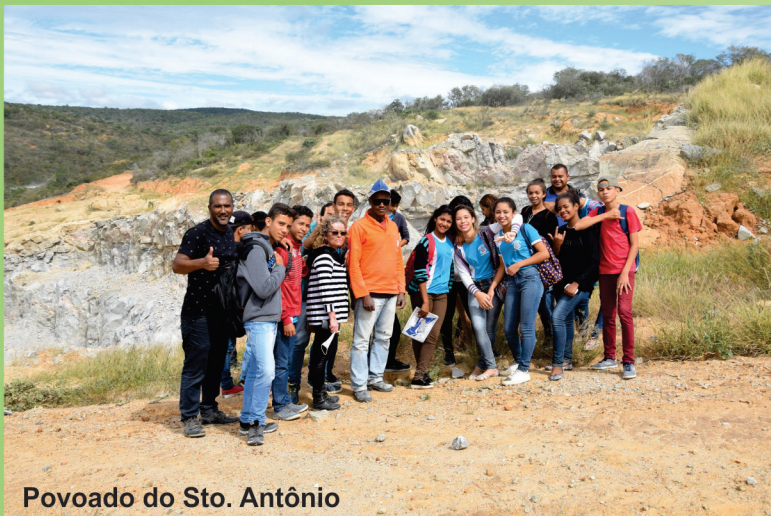
Povoado do Sto. Antônio