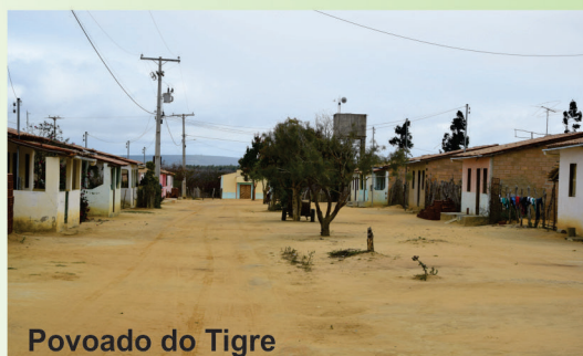
Povoado do Tigre