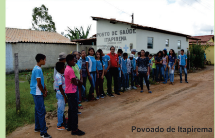
Povoado de Itapirema