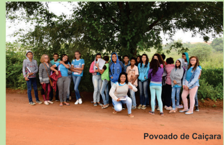
Povoado de Caiçara