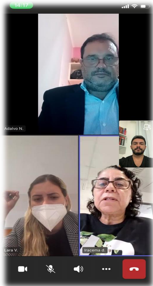
Rateio dos recursos dos precatórios do FUNDEB – Pj Irará

Nos meses de novembro e dezembro houve reuniões orientativas com algumas promotorias de justiça