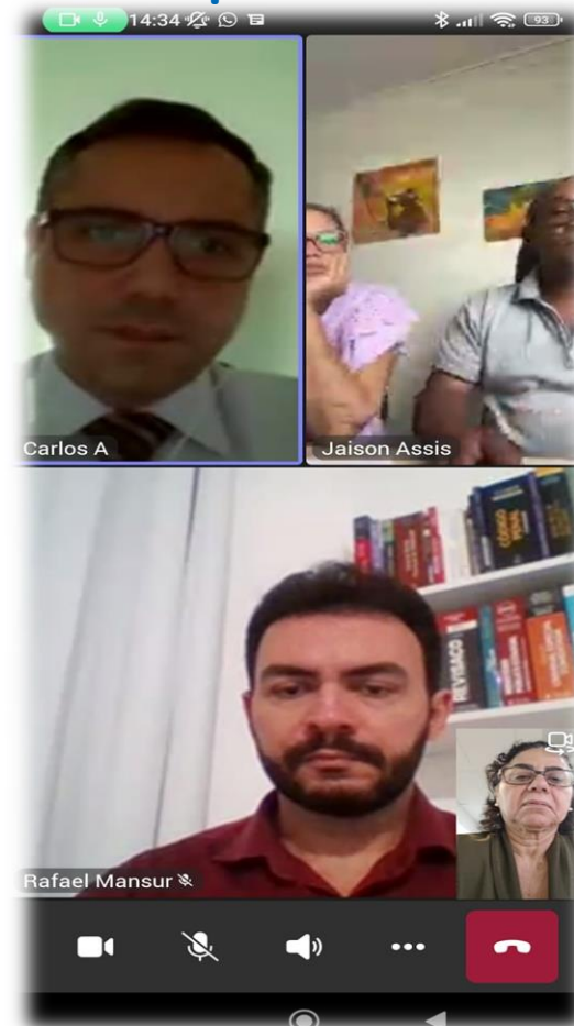
Substituição de professores por estagiários– PJ Santo Estevão